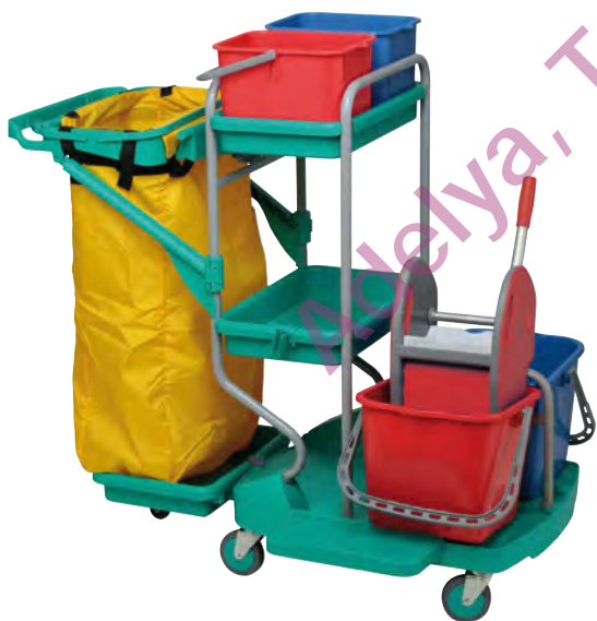
Chariot livré sans presse et sans sac.

Adapté aux espaces réduits Pratique et maniable Stable (5 roues)