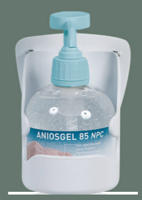
Support mural Réf. 425 078