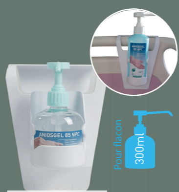
Support lit Réf. 425 251