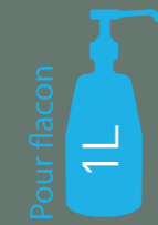
Distributeur commande au coude Réf. 425 091

Réf. xxxx.229* Réf. xxxx.364* Réf. xxxx.523* Réf. xxxx.637* Réf. xxxx.763* (3ml)