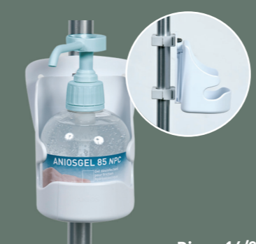
Support fixe sur lit

Réf. xxxx.229* Réf. xxxx.364* Réf. xxxx.523* Réf. xxxx.637* Réf. xxxx.763* (3ml)