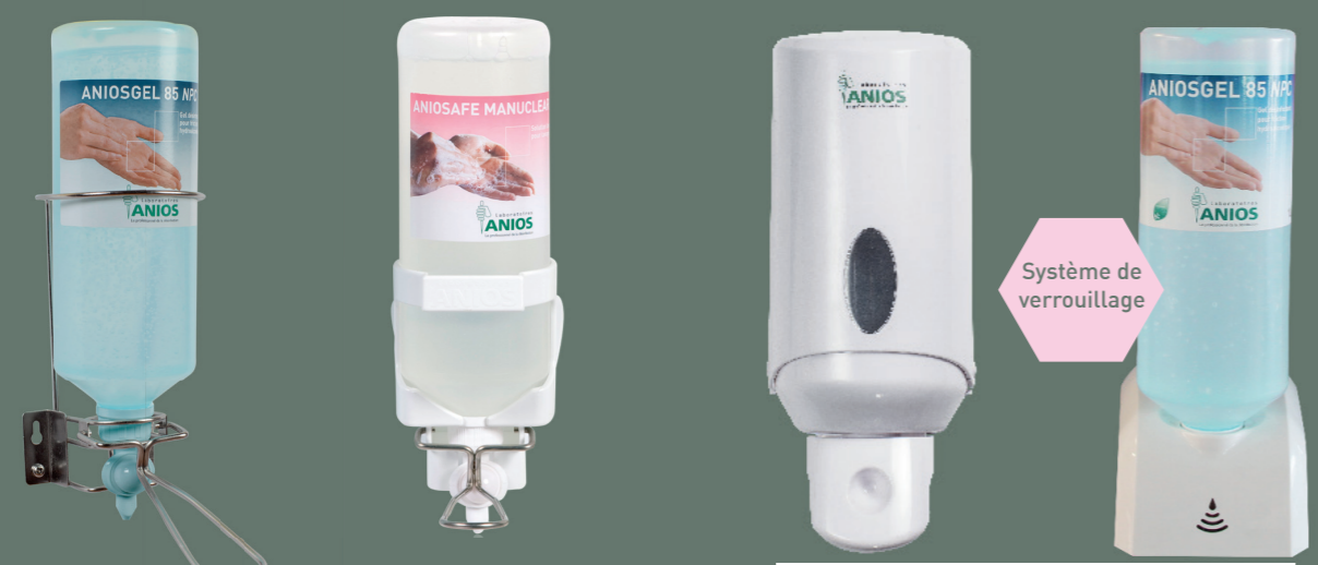
Distributeur Delta acier inox commande au coude Réf. 425 178