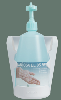
Support lit Réf. 425 249