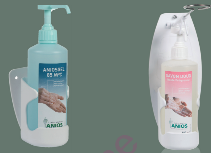
Support mural Réf. 425 058