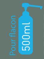
Distributeur commande au coude Réf. 425 092

Réf. xxxx.228* Réf. xxxx.363* Réf. xxxx.522* Réf. xxxx.636* Réf. xxxx.748* (3ml)