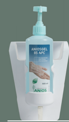
Support lit Réf. 425 250